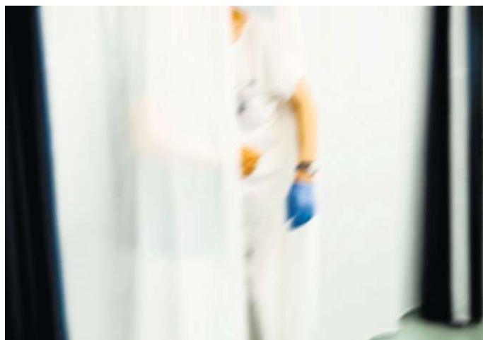
An der Street Parade passt das Pflegepersonal traditionsgemäss sein Outfit an. Die meisten haben Plastikblumen in den Haaren, andere haben sich Hasenohren aufgesetzt oder eine farbige Perücke.